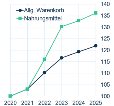
Abb. 2: Preisniveau: Nahrungsmittel und allgemeiner Warenkorb (2020=100)